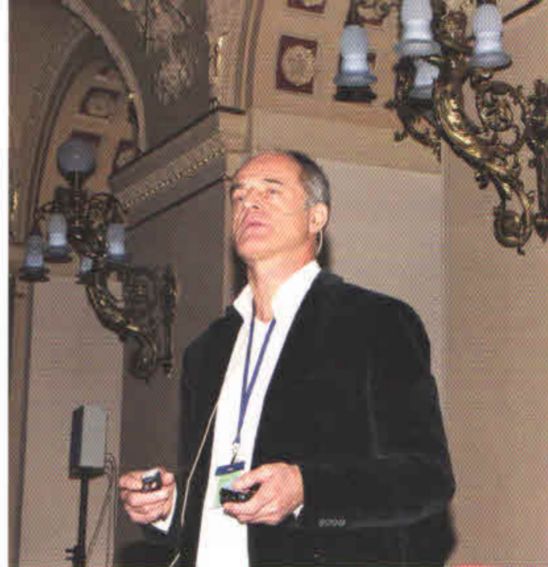
Před nabitým sálem na Žofíně přednášel v rámci Italského dne Lorenzo Vanini o estetické stomatologii. K hvězdám PDD patřil již potřetí.

Příprava letošních Pražských dentálních dnů 2010 je již v plném proudu. Abychom vás již teď na kongres správně naladili, nabízíme vám malou rekapitulaci minulého ročníku. PDD 2009 byly plné zajímavých témat, pod nimiž byli podepsáni odborníci zvučných jmen i ti, kteří své zkušenosti v roli přednášejících teprve sbírají. A to je jeden ze sympatických momentů pražského kongresu.