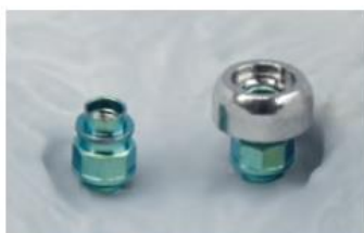
Na hlavu je umístěn abutment a k němu je nabodováno zařízení.