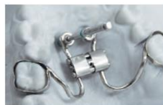
Zařízení je připevněno k hlavě miniimplantátu pomocí přídržného šroubu.

Minišrouby nejsou sterilní – nutno vždy sterilizovat!