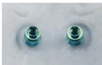
Umístění OrthoEasy Pal do patra.